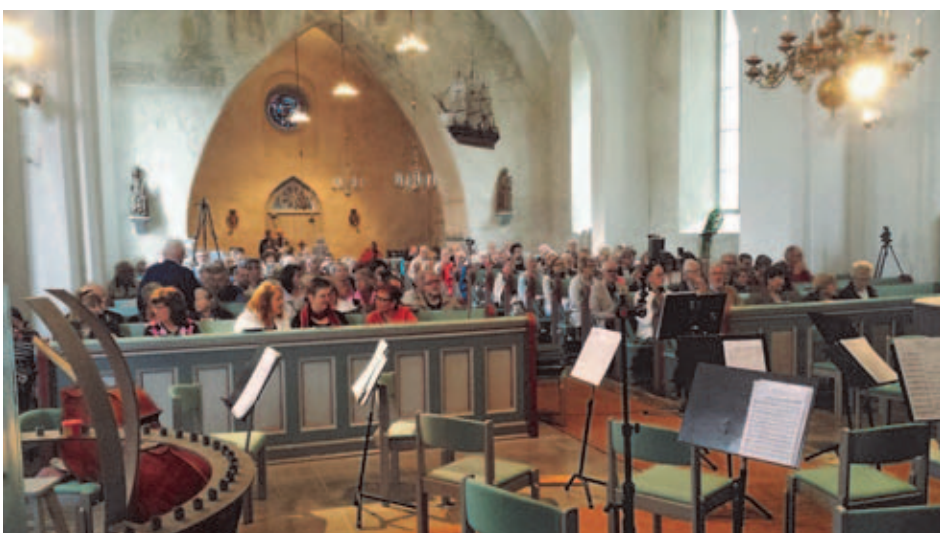
27.6.2015. Publiken vid jubileumskonserten i Jomala kyrka