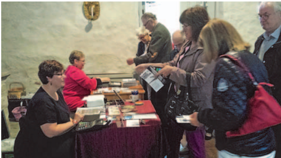
27.6.2015. Postens specialstämpling i samband med festivalens 40-års jubileum